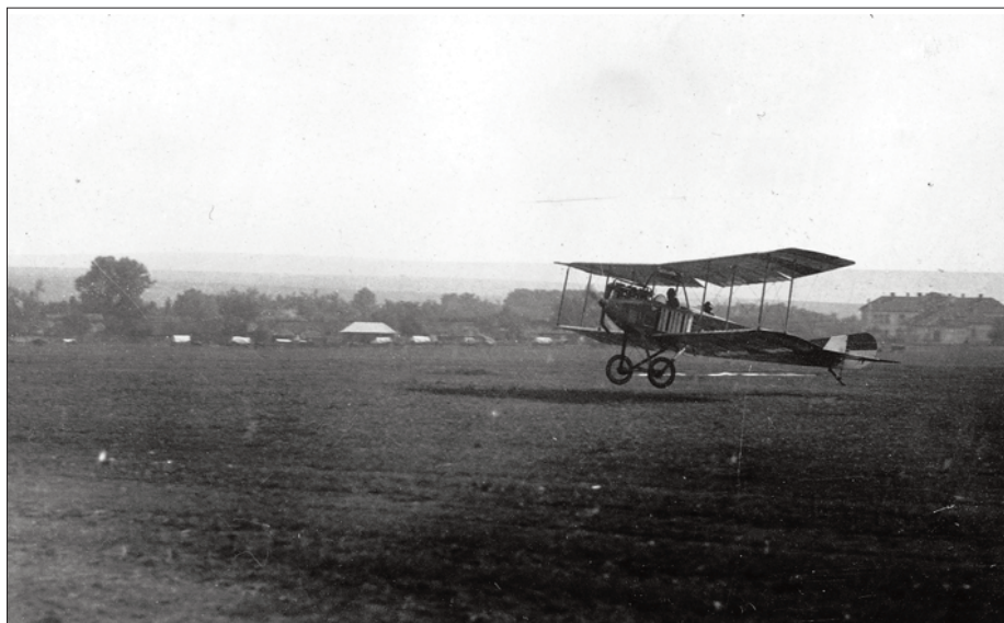
Albatros B I od Flik 1 při startu na neidentifikovaném polním letišti na ruské frontě

Zrekapitulujme si jednotky, hodnosti a funkce, kterými prošel: Flik 1 – nadporučík v záloze, Flik 18 – nadporučík v záloze, šéfpilot, tj. zástupce velitele setniny, Flik 102 G – rytmistr (kapitán) v záloze, komandant (velitel) a nakonec Fliegergruppe G – se stejnou hodností velitel celé skupiny. Na záložního důstojníka jezdeckta poměrně slušná letecká kariéra. Po skončení I. světové války opouštěl armádu jako rytíř řádu Železné koruny 3. třídy s vojenskou dekorací, nositel vojenského záslužného kříže 3. třídy s vojenskou dekorací, stříbrné a bronzové vojenské záslužné