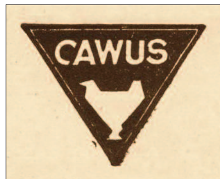
Carl Weissshuhn Und Söhne – firemní logo (CAWUS)

◀ Celkový pohled na továrnu ve Svobodě nad Úpou (v popředí provizorní parní pila maršovského velkostatku vybudovaná k likvidaci následků větrné katastrofy z října 1930)