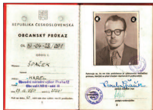
Falešný občanský průkaz agenta Brabce, 1950