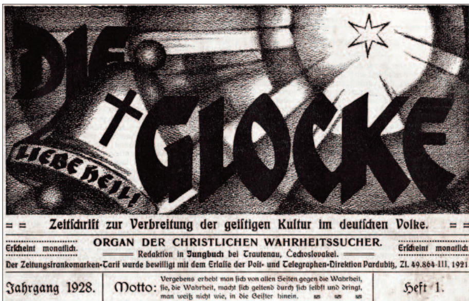
Záhlaví titulního listu spolkového časopisu Die Glocke – Zvon – s mottem Liebe heil – Lásce zdar!