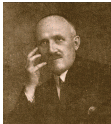
Ignác Etrich a Josef Kahler