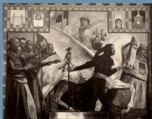
Figurální obraz Dominika Brosicka, rytíře Nykkuse, který vyzdobil sídlo jablonecké Schlaraffie.