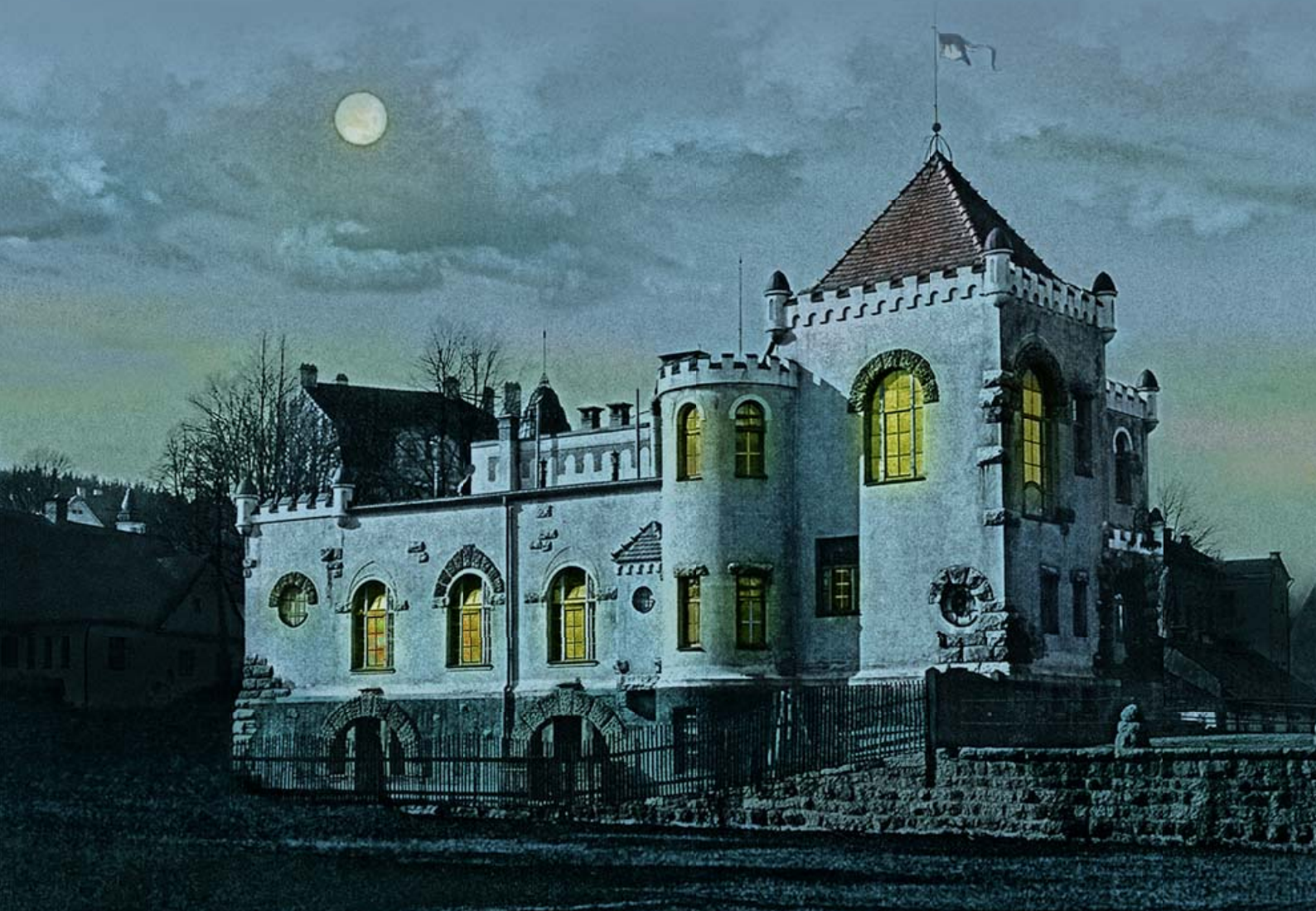
Sídlo Jablonecké Schlaraffie Preciosa Iserina.