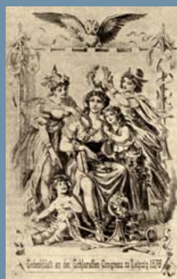
Pamětní spis I. kongresu Všešlarafie v Lipsku v roce 1876.