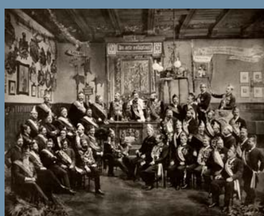
Šlarafové říše Teplitia v Teplicích-Šanově, jedné z nejstarších říší, založené v roce 1880.

Sbírkové předměty a archivní materiály na výstavu zapůjčilo Krkonošské muzeum Vrchlabí, Městské muzeum ve Frýdlantu, Muzeum skla a bižuterie v Jablonci nad Nisou, Oblastní muzeum v Děčíně, Regionální muzeum v Teplicích, Severočeské muzeum v Liberci, Státní okresní archiv Jablonec nad Nisou, Vědecká knihovna v Olomouci a soukromí sběratelé.